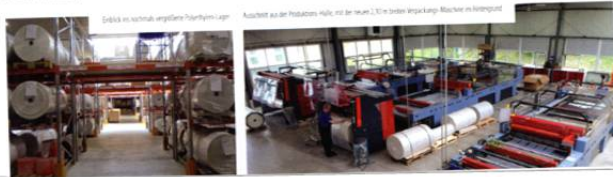
Einblick ins technisch anspruchsvolle Poly-Pack-Werk

Poly-Pack Verpackungs-GmbH & Co. KG Zollhausstraße 7 | 58640 Iserlohn Telefon: 02371-9398-0 | Telefax: 02371-9398-44 info@poly-pack.de | www.poly-pack.de